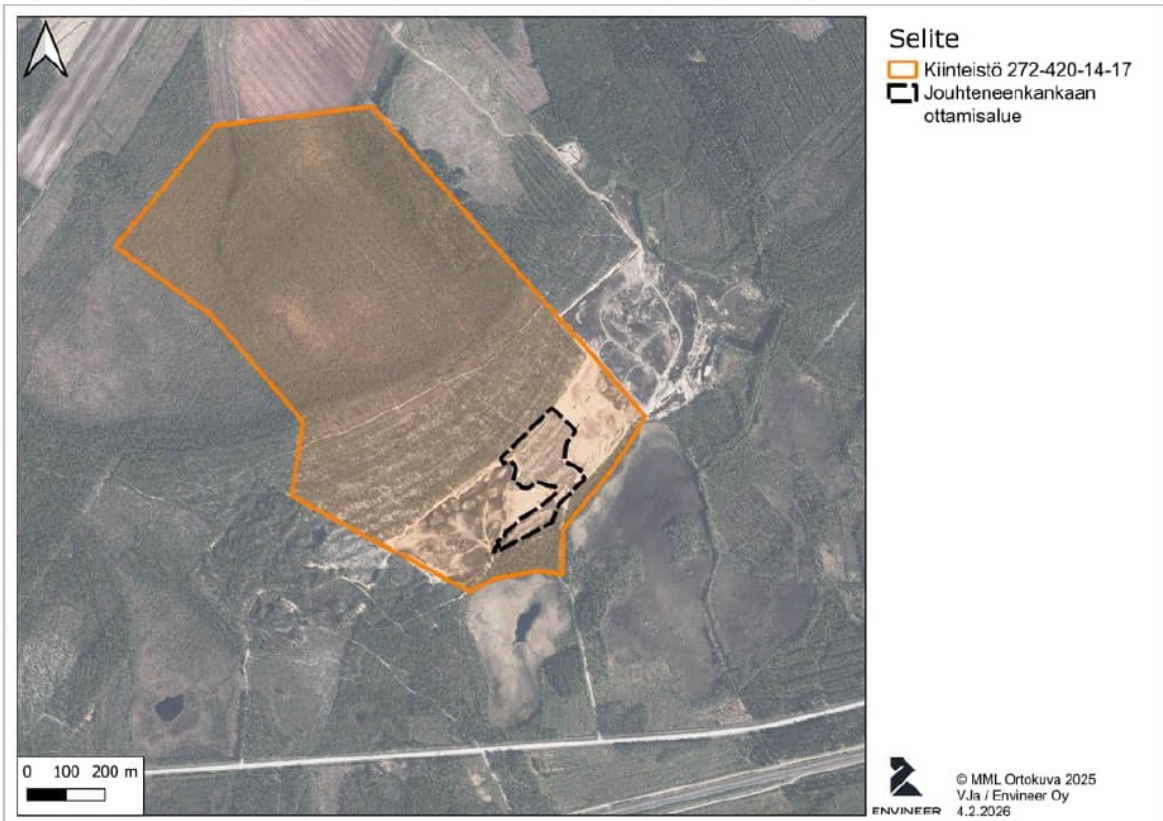
Kuva 2. Ottamislue