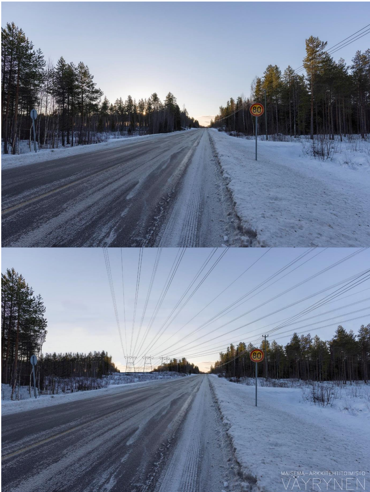
Kuvauspaikka A. Havainnekuva Ullavantieltä (kantatie 63) (SVE1).