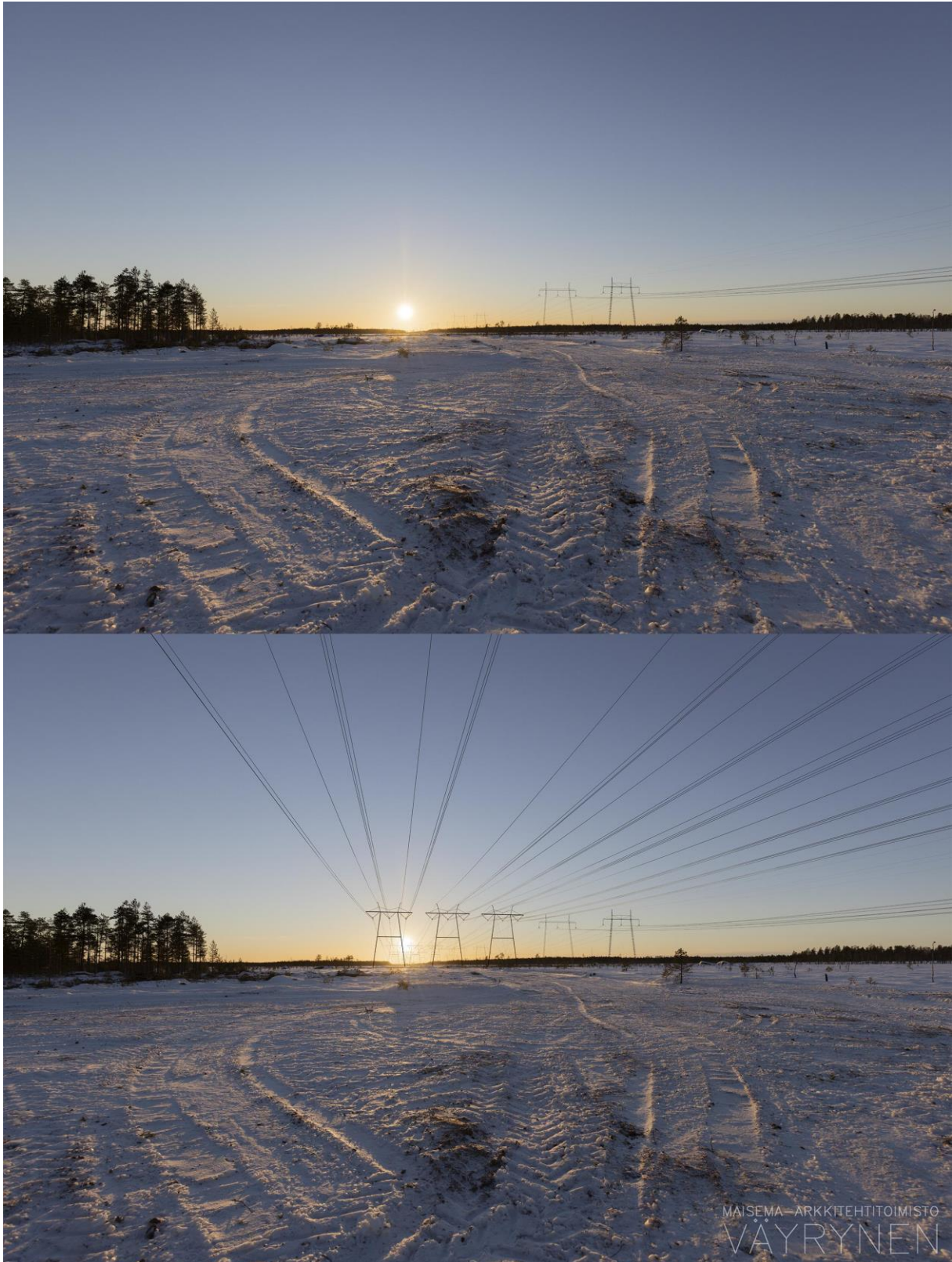
Kuvauspaikka C. Havainnekuva Ahvenlammilta (SVE3).