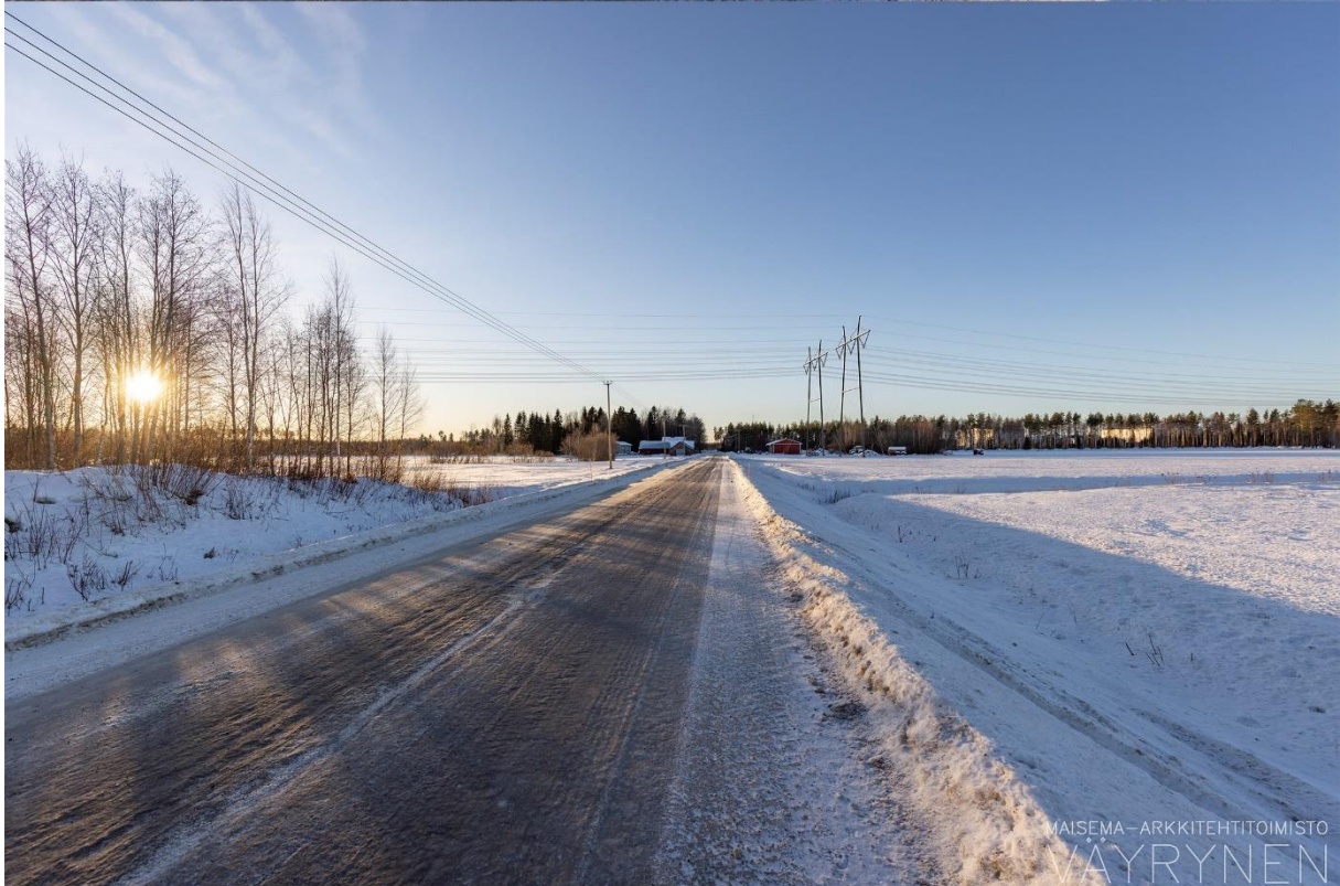
Kuvauspaikka B. Havainnekuva Härkänevantieltä kohti voimajohdon reittivaihtoehtoa SVE3.