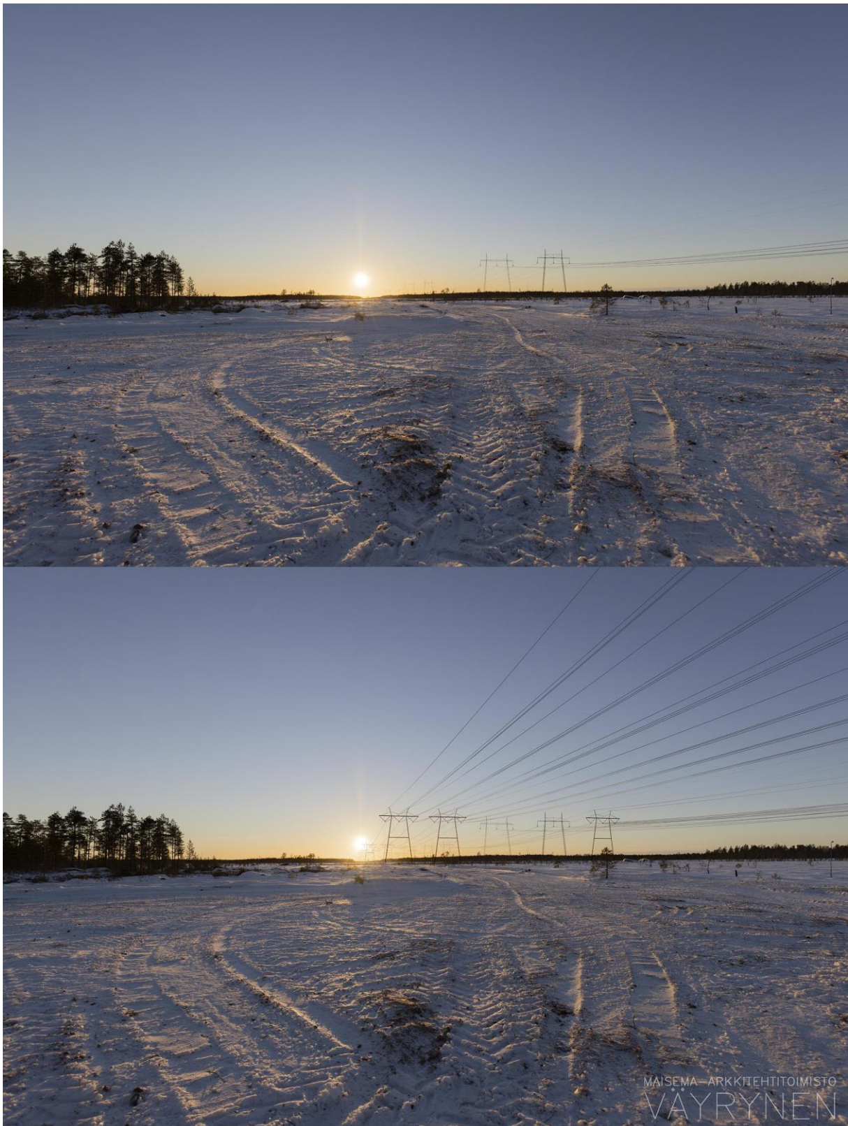
Kuvauspaikka C. Havainnekuva Ahvenlammilta (SVE3).