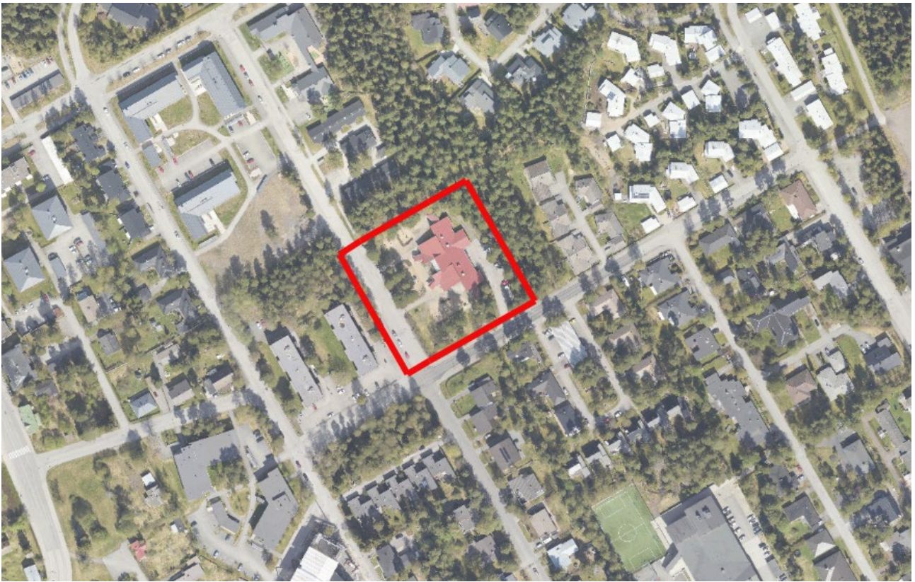
Ilmakuva 2023. Suunnittelualue rajattuna punaisella.