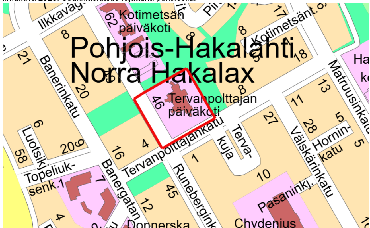
Suunnittelualueen sijainti rajattuna punaisella opaskartalla.