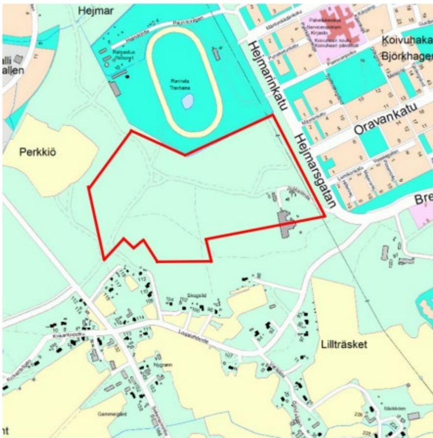
Ote kaavoituskatsauksessa esitetystä alustavasta aluerajauksesta.