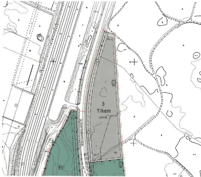
Kuva 1. Ote Hopeakivenlahdentien eteläosan kaavaehdotuskartasta.

Varaus kattaa koko T/kem-kaavoitetun alueen (korttelinumero 3) LNG-termiinalin ja sen tukitoimintojen rakentamista ja mahdollista laajentamista varten. T/kem kaavoitetun alueen pinta-ala on 2,1324 ha ja kerrosala on 6 397 m 2 .