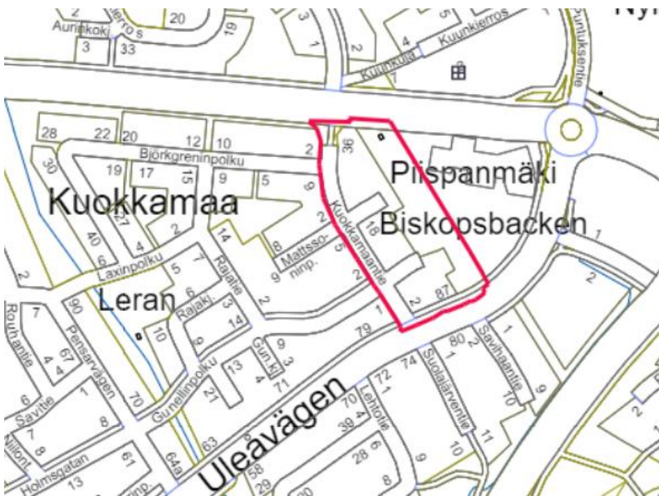
Suunnittelualueen rajaus opaskartalla