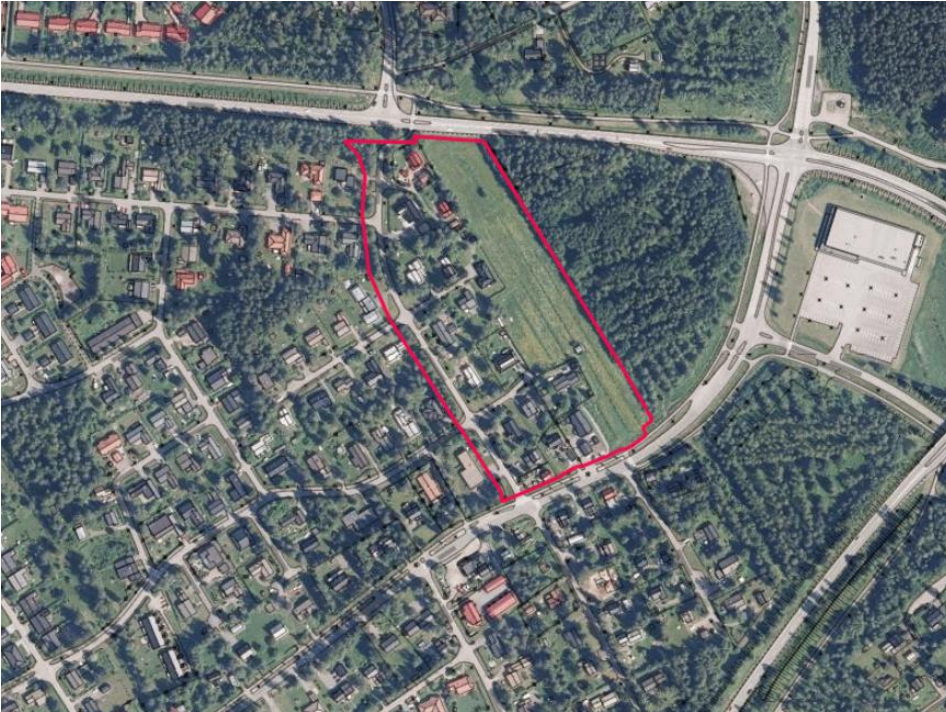
Suunnittelualueen likimääräinen rajaus ilmakuvassa.